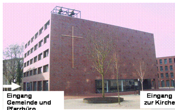
Eingang Gemeinde und Pfarrbüro